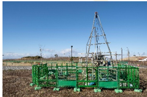
・ ボーリング調査