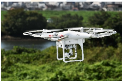
・ 空中測量・画像解析